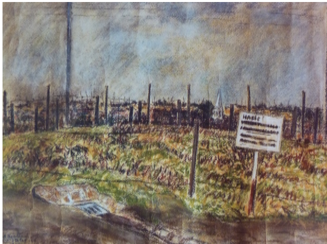
Transitlager, 1942. Pastell, 30 x 40 cm. Slg. Oleksandr Feldman, Charkiv

Lit: „Seize peintres à Paris“, Musée du Petit Palais, Genève 1971.