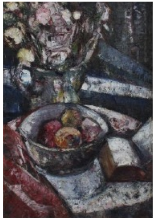
Stilleben. Öl/Lw. 67 x 46 cm.

Blaufuks gehört zwischen 1918 und 1923 zur Bewegung „Jung Idysz“. 1934 Beteiligung mit Werken im Salon der Jüdischen Vereinigung in Warschau für die Förderung der bildenden Künste in Palästina. Er wird 1942 von den Nazis ermordet.