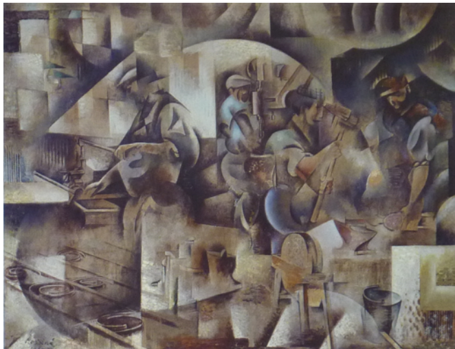
La Forge 1911, Öl/Lw. 162 x 210 cm. MNAM Paris, Leihgabe im Musée d'Art moderne et contemporain, Strasbourg

Lit.: P. Breuillard-Limondin / M.J. Mausset. B.-R. Diss. Univ. Paris 1979/80 (Werkverzeichnis). Retrospektive Gal. Brusberg 1983.