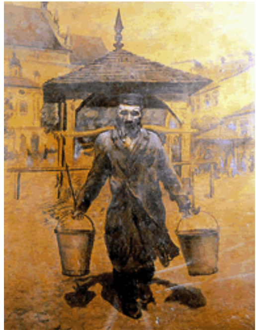
Wasserträger auf dem Marktplatz von Kaszimierz Dolny. Jüdisches Historisches Institut, Warschau

Studium der Malerei in München 1900 – 1904. Zahlreiche Porträts von polnischen Juden. Er malt auch Landschaften, Stadtansichten und Genreszenen. Dabei verwendet er vor allem die Ölmalerei und die Pastellzeichnung. Viele Bilder entstehen auf seinen Reisen nach Marokko, Tunesien, Algerien, Ägypten, Palästina und dann nach Spanien, Frankreich und Italien. Nach dem Ausbruch des Weltkriegs flieht Behrman nach Bialystok. Nach der Ankunft der Deutschen leitet er hier die Malwerkstatt von Oscar Steffen, der auf das Kopieren alter Gemälde spezialisiert ist. Er stirbt im Ghetto Bialystok.