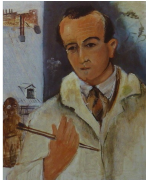
Erich Brill. Selbstbildnis mit Doppelgänger. 1921. Öl/Lw. 62,5 x 50 cm. Privatbesitz

Literatur: Erich Brill. Pintor e viajante. Pinacoteca do Estado, Sao Paulo 1995. Maïke Bruhns. Geflohen aus Deutschland. Hamburger Künstler im Exil 1933-45. Bremen 2007.