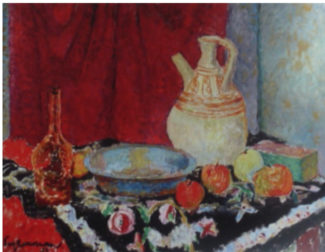
Stilleben. 1937. Öl/Lw., 60 x 80,5 cm Nationalmuseum Warschau

Lebt 1927 – 1931 in Paris. Nach der Rückkehr nach Polen in Warschau. Ausstellungsbeteiligungen in Paris 1930, 1931 im polnische Kunstklub in Warschau, im Institut für die Verbreitung der Kunst 1934, 1938 und 1939, ebenso 1933 in Posen, in der Gesellschaft der Freunde der bildenden Kunst in Lviv 1937, ebenso in Krakau und in Genf. Sie malt Landschaften aus der Umgebung von Krakau, im Bezirk Mokotow, Skala und Rudki in Warschau, ebenso Stilleben, Blumenstücke, Interieurs und auch Figurenbilder. Sie benutzt eine Skala intensiver Farben, in einem Stil der nahe beim Pointillismus liegt. Beeinflusst ist sie speziell von Matisse und Bonnard.