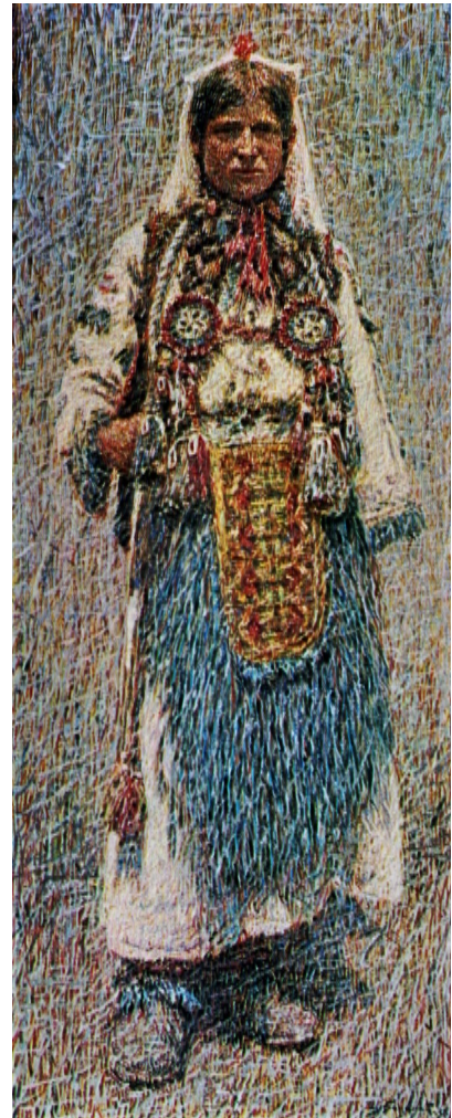
Spiro Bocaric. Frau aus Bosnien. 1936 Öl/Lw. 67 x 28 cm. Kunstgalerie Montenegro, Cetinje

Lit. Montenegrinische Kunst in der ersten Hälfte des 20. Jhs. Zentrum für Kunstausstellungen der DDR, Berlin 1975.